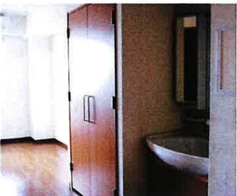
ゆったりとした広さの居室。家具は木目調で統一