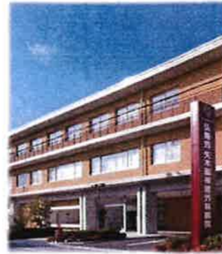
弘善会 矢木脳神経外科病院

医療・福祉活動を通じて 地域社会に貢献することにより、 社会的責任を果たすことが 私たちの使命です。