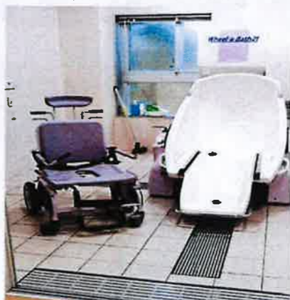
特殊浴槽（個室個別対応）