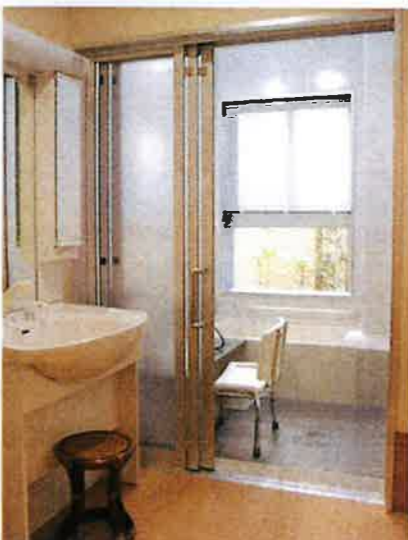
坪庭付きの一般浴室