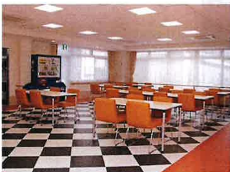
開放感のある1階食堂