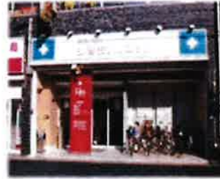
弘善会クリニック