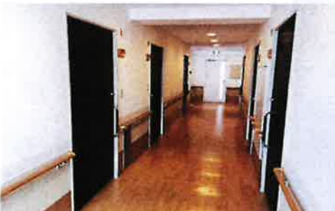
光が射し込み、明るい廊下